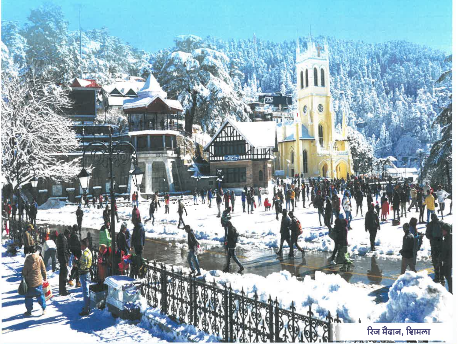
रिज मैदान, शिमला