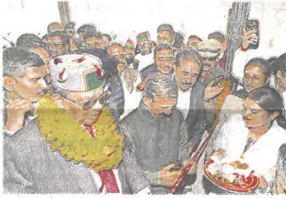
बरोटीवाला में अस्पताल का लोकार्पण करते मुख्यमंत्री सुखविंदर सुक्खू

● हम हिमाचल के संसाधनों के संरक्षक, राज्य की संपत्तियों को लूटने नहीं देंगे