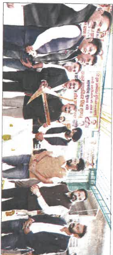
बददी : दून विधानसभा क्षेत्र के एकदिवसीय दौरे पर पहुंचे मुख्यमंत्री सुख्यू को सम्मानित करने का दौर

में उदार गए कदम थे। सीएम सुख्यू ने स्पष्ट चेतावनी देते हुए कहा कि हम हिमाचल के संसाधनों के संरक्षक हैं। राज्य की संपत्ति को किसी भी कीमत पर लूटने नहीं देंगे। दून विधानसभा क्षेत्र के एक दिवसीय दौरे के दौरान बददी में आयोजित जनसभा में मुख्यमंत्री ने भाजपा पर जमकर हमला बोला। मुख्यमंत्री ने कहा कि जैसे ही वर्तमान सरकार ने भ्रष्टाचार के रास्ते पर रोक लगाई, भाजपा का सोशल मीडिया सेल बौखलाहट में उन्हें निशाना बनाने लगा। हमने विधवाओं, अनाथ बच्चों, भोजपा ने कस्टमाइज : पूर आट पर