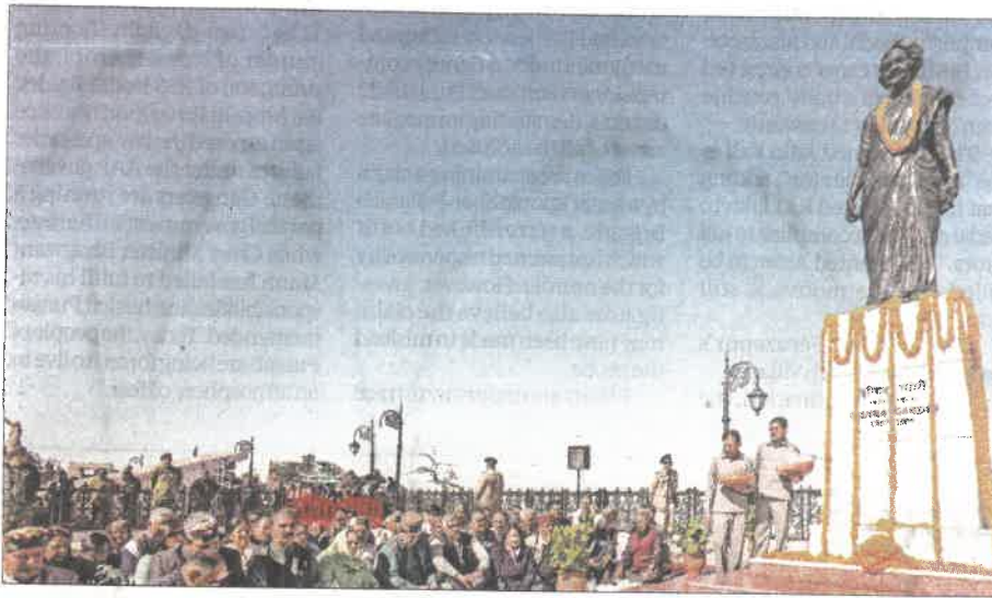
Himachal Pradesh Chief Minister Sukhvinder Singh Sukhu and others pay tribute to former Prime Minister Indira Gandhi on her birth anniversary, in Shimla on Wednesday.