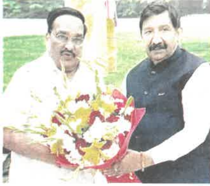
ऊना : दिल्ली में जल शक्ति मंत्री सी.आर. पाटिल से मुलाकात करते डिप्टी सी.एम. मुकेश अग्निहोत्री।