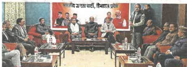
भाजपा विधायक दल की बैठक की अध्यक्षता करते हुए नेता प्रतिपक्ष जयराम ठाकुर