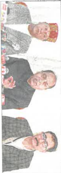
पत्रकारों को संबोधित करते नेता प्रतिपक्ष जयराम ठाकुर।

पूर्व मुख्यमंत्री जयराम ठाकुर ने कहा कि वर्तमान कांग्रेस सरकार का 3 साल का जश्न गाले से नहीं उतर रहा है। प्रदेश आपदा से जूझ रहा है। हिमाचल प्रदेश में डिजिटल एक्ट लागू है। जिसका हवाला देकर मुख्यमंत्री की ओर से पंचायत चुनाव को स्थगित करने की कोशिशें जारी हैं।