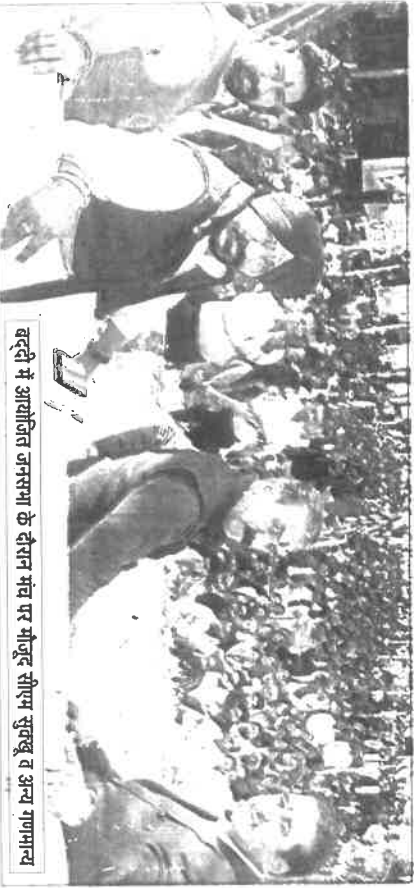
बददी में आयोजित जनसभा के दौरान भव पर मोहर सीएम सुखू व अन्य गणमान्य

बददी सिविल अस्पताल की क्षमता बढ़ाकर 100 बिस्तर की होगी, 10 करोड़ से बनेगा स्टीडियम एसडीएम ऑफिस निर्माण को मिलेंगे 25 करोड़, अत्याधुनिक बस स्टैंड बनाने का भी किया वादा दून के एक दिवसीय दौर में 383 करोड़ की परियोजनाओं का किया लोकार्पण और शिलान्यास