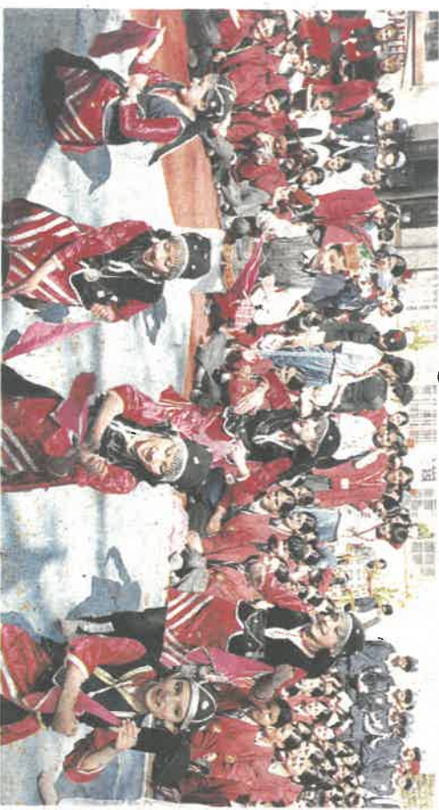
शिमला : राजकीय पाठशाला पोर्टमोर में वार्षिक पारितोषिक वितरण समारोह के दौरान सांस्कृतिक प्रस्तुति देती छात्राएं।