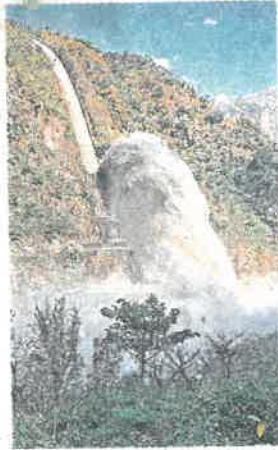
बीबीएमबी के बीएसएल प्रोजेक्ट के 990 मेगावाट के डैम पावर हाउस के बाईपास शूट से छोड़ा गया पानी

बात कुछ पुरानी है। चंडीगढ़ में भाखड़ा ब्यास मैनेजमेंट बोर्ड की बैठक थी। तत्कालीन केंद्रीय ऊर्जा मंत्री पीयूष गोयल अध्यक्षता कर रहे थे। बीबीएमबी के बड़े अधिकारी ने पावर प्वाइंट प्रेजेंटेशन आरंभ की। बीबीएमबी में राज्यों की भागीदारी में उन्होंने हिमाचल प्रदेश का नाम नहीं लिया। हिमाचल प्रदेश के एक अधिकारी इसी बात पर उखड़ गए। हिमाचल प्रदेश के अधिकारी ने आपत्ति दर्ज करते हुए कहा कि यह स्वीकार्य नहीं है। आपके बांध ही नहीं, सब कुछ हिमाचल प्रदेश में है और आप उसका नाम ही नहीं ले रहे? कुछ देर हंगामा हुआ, मंत्री महोदय भी नाराज हुए लेकिन बात समझ में आने पर उन्होंने हिमाचल प्रदेश के पक्ष को समझा। सवाल यह है कि पक्ष समझने भर से क्या होता है। हिमाचल प्रदेश का पक्ष तो सुप्रीम कोर्ट ने भी समझा लेकिन नवंबर 2011 के निर्णय के अनुरूप 4500 करोड़ रुपये का एरियर अब तक नहीं मिला।