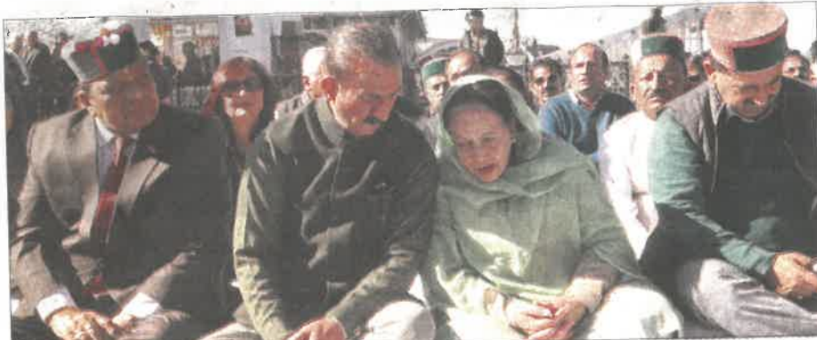
CM Sukhvinder Singh Sukhu with state Congress chief Pratibha Singh and other party leaders pays tributes to former PM Indira Gandhi on her birth anniversary in Shimla on Wednesday.