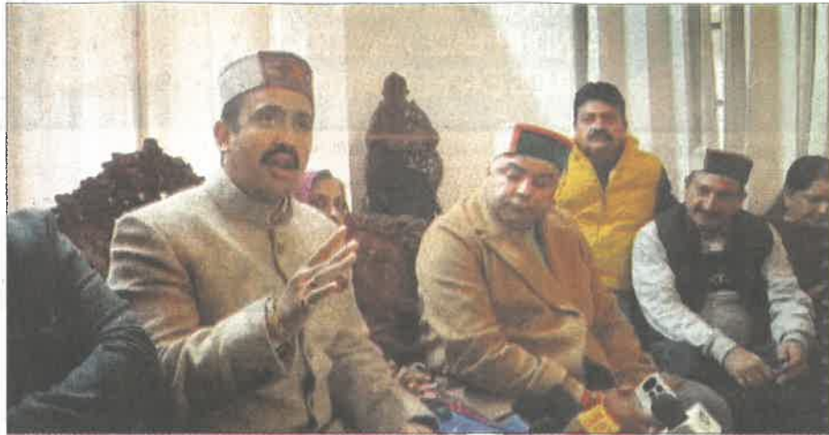
PWD Minister Vikramaditya Singh addresses a press conference in Chamba on Wednesday.

Singh said the state government made continuous efforts to ensure timely restoration of all major roads—National Highways (NH), Major District Roads (MDR), and link roads across Chamba's constituencies. He added that approvals for road repairs and construction have been taken up on priority with Central agencies.