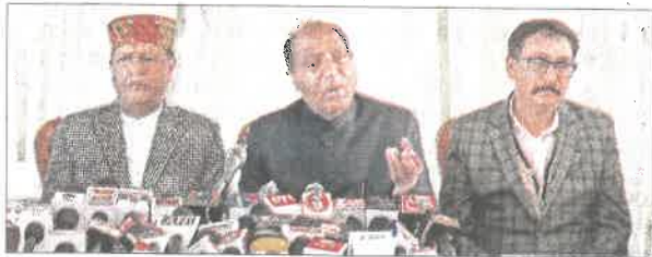
LoP Jai Ram Thakur, BJP chief Dr Rajeev Bindal and party MLA Vipin Singh Parmar address the media in Shimla on Wednesday.

Fielding questions on the Bihar Assembly elections, the LoP said the Bihar verdict sent a clear message to the Congress, which would be facing even worse in Himachal. "The Congress will be nowhere to be seen in the next Himachal Assembly election. The people of the state will pack the Congress's bag, which came to power on fake guarantees," he said.