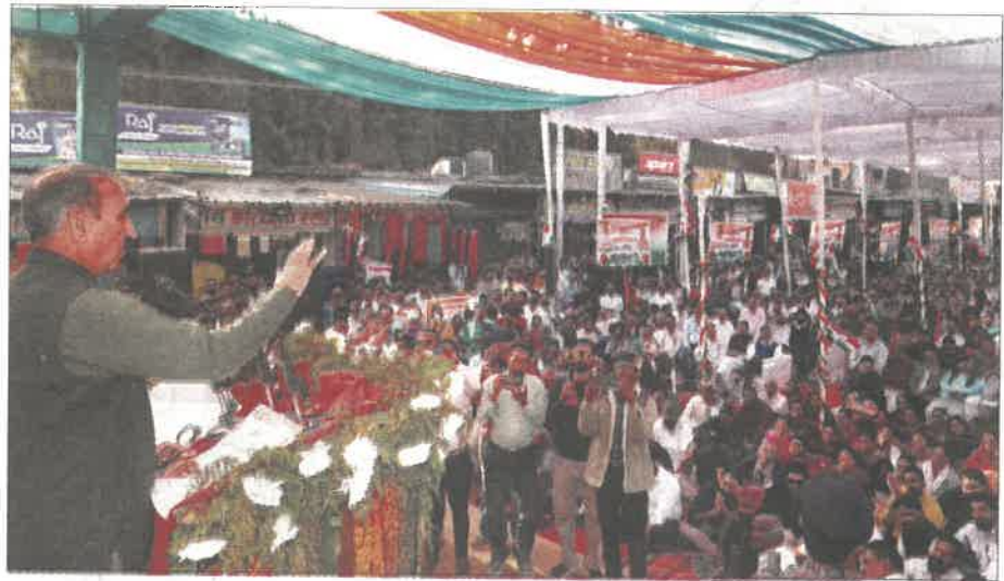
Chief Minister Sukhvinder Singh Sukhu addresses a gathering at Baddi on Wednesday.

While addressing a gathering at Baddi during his day's tour, he launched a scathing attack on the previous BJP government for turning a blind eye to corruption. "The stamp duty was waived and provisions were made to supply electricity at Rs 3 per unit for five years besides providing free water under this package. As long as I am Chief Minister, I will not allow the state's assets to be plundered. We are custodians