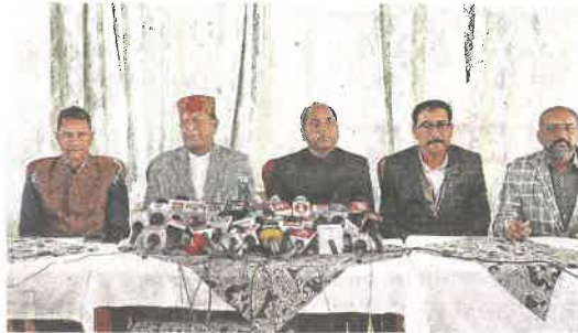
प्रेस वार्ता को संबोधित करते हुए भाजपा अध्यक्ष राजीव बिंदल और नेता प्रतिपक्ष जयराम ठाकुर

शिमला में पत्रकार वार्ता को संबोधित करते हुए जयराम ठाकुर ने कहा कि बिहार चुनाव के नतीजे और प्रदेश सरकार की कथित नाकामियां साफ संकेत देती हैं कि जनता कांग्रेस से नाराज है। उन्होंने बताया कि भाजपा विधायक दल धर्मशाला के तपोवन में होने वाले शीतकालीन सत्र में हर मुद्दे पर चर्चा के लिए पूरी तरह तैयार है। यदि सदन के भीतर विपक्ष की आवाज दबाने की कोशिश हुई तो भाजपा बाहर जनता के