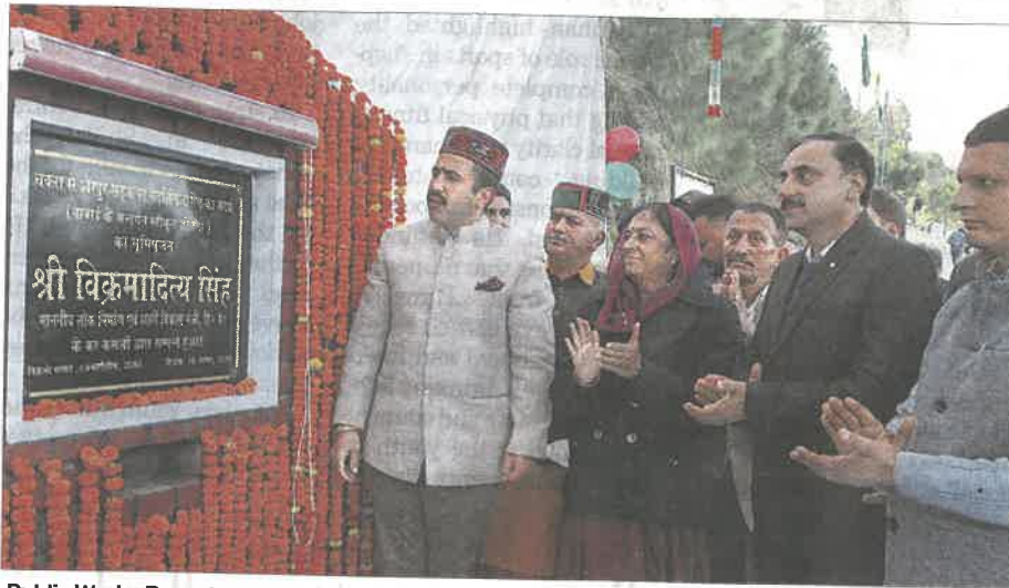
Public Works Department Minister Vikramaditya Singh lays the foundation stone of a road project in the Dalhousie Assembly segment of Chamba district on Wednesday.

Vikramaditya performed the bhoomi puja of the Chakhar-Sherpur road upgrade project in Tappar gram panchayat of the Dalhousie Assembly constituen-