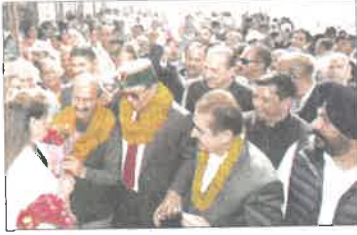
मानपुरा: बड़ी पहुंचने पर मुख्यमंत्री सुखविंदर सिंह सुक्खू व स्वास्थ्य मंत्री का स्वागत करते विधायक एवं कांग्रेस कार्यकर्ता। (बस्सी)

मानपुरा, 19 नवम्बर (बस्सी): मुख्यमंत्री सुखविंदर सिंह सुक्खू ने बुधवार को दून विधानसभा क्षेत्र के 18 आपदा प्रभावित परिवारों को 17,62,000 रुपए की राहत राशि और प्रधानमंत्री आवास योजना-ग्रामीण के 15 लाभार्थियों को अंतिम किस्त के रूप में 17,03,000 रुपए के चेक प्रदान किए। क्षयरोग उन्मूलन कार्यक्रम के अंतर्गत 3 क्षयरोगियों को पोषण किटें भी प्रदान कीं। मुख्यमंत्री ने इस अवसर पर बड़ी में जनसभा को संबोधित करते