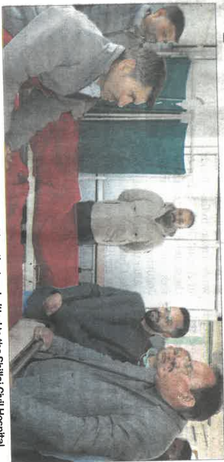
Minister Harshwardhan Chauhan interacts with patients admitted to the Shillai Civil Hospital.

Stepping into various hospital units, the minister held direct interactions with doctors to understand their immediate requirements for improving patient care. He also met patients admitted in different wards and gathered feedback on the treatment and arrangements provided to them. The inspection of the