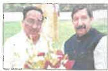
केंद्रीय मंत्री सीआर पाटिल से मिलते मुकेश अग्निहोत्री।

ऊना। उपमुख्यमंत्री मुकेश अग्निहोत्री ने दिल्ली में केंद्रीय जल शक्ति मंत्री सीआर पाटिल से शिष्टाचार भेंट की। बैठक के दौरान बताया गया कि हिमाचल प्रदेश के लिए प्रधानमंत्री कृषि सिंचाई योजना (पीएमकेएसवाई) की लंबित 58.75 करोड़ रुपये की राशि जारी कर दी गई है। मुकेश ने इसके केंद्रीय मंत्री का आभार व्यक्त किया। संवाद