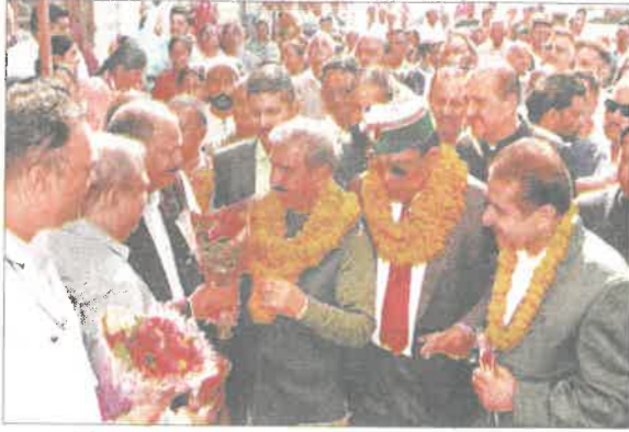
बरोटीवाला में सीएम का स्वागत करते अधिकारी और अन्य। संवाद

बद्दी में जनसभा को संबोधित करते हुए मुख्यमंत्री ने पूर्व भाजपा सरकार पर तीखा हमला बोला। उन्होंने आरोप लगाया कि भाजपा सरकार ने सैकड़ों करोड़ की 5,000 बीघा