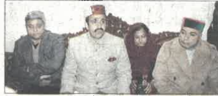
चम्बा : पत्रकार वार्ता के दौरान लोक निर्माण तथा शहरी विकास विभाग मंत्री विक्रमादित्य सिंह।

उन्होंने बताया कि पी.एम.जी.एस.वाई.-4 के तहत जिला चम्बा में 327 किलोमीटर लंबी सड़कों का निर्माण किया जाएगा। विक्रमादित्य सिंह ने कहा कि वह सकारात्मक राजनीति में विश्वास रखते हैं। हिमाचल के हितों की उन्होंने केंद्र सरकार के समक्ष आवाज उठाई और पी.एम.जी.एस.वाई.-4 के लिए बजट स्वीकृत करवाया।