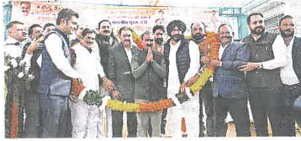
बंदी में मुख्यमंत्री सुखविंदर सिंह सुक्खू का स्वागत करते दून कांग्रेस के नेता

में सरकार की ओर से उठाए कदमों पर भी बात की। उन्होंने कहा, जब उन्होंने सरकार संभाली तो प्रदेश में शिक्षा का स्तर बिगड़ा था। पांचवीं के बच्चे दूसरी कक्षा की किताब नहीं पढ़ पाते थे, लेकिन हमारी सरकार ने नीतियां बदलीं और व्यवस्था परिवर्तन किया। इससे अब हिमाचल की शिक्षा के स्तर में 21वें स्थान से सुधार हुआ है। आपदा प्रभावितों को पहले डेढ़ लाख रुपये मिलते थे, हमने इसे बढ़ाकर सात लाख किया।