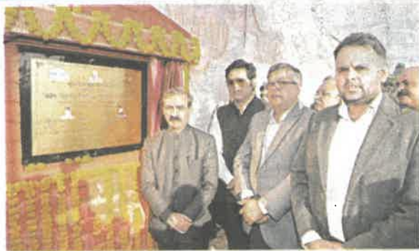
पालमपुर में हेलीपोर्ट का शिलान्यास करते सीएम सुखु ।

उन्होंने कहा कि राज्य सरकार कांगड़ा जिले के लिए कई विकासात्मक योजनाएं तैयार कर रही हैं। पालमपुर में एक पर्यटन गांव विकसित करने का प्रस्ताव भी तैयार किया गया था, लेकिन भाजपा के कुछ लोगों ने अदालत का दरवाजा