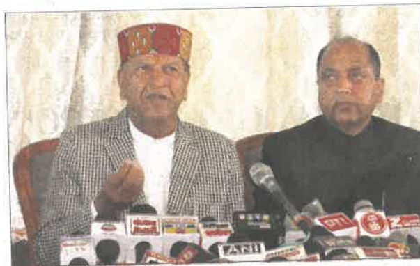
State BJP president Rajeev Bindal and Leader of Opposition Jai Ram Thakur address mediapersons in Shimla.

Addressing reporters in Shimla, state BJP president Rajeev Bindal said party workers from across Himachal Pradesh would converge in Dharamsala for the demonstration. He alleged that the Congress regime had pushed the state towards