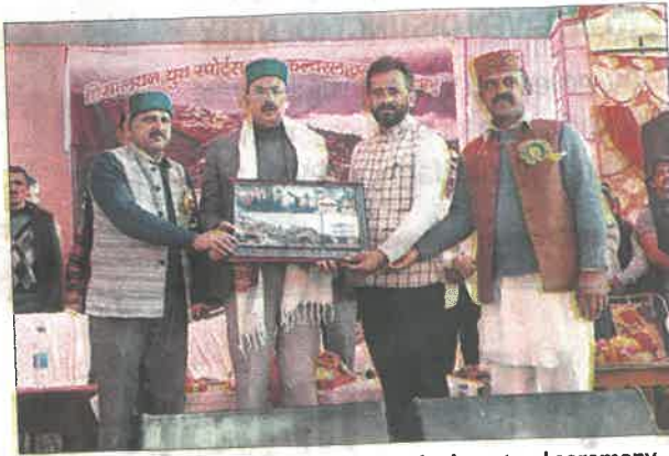
Minister Harshwardhan Chauhan at the inaugural ceremony.

Encouraging the youth to direct their energy toward