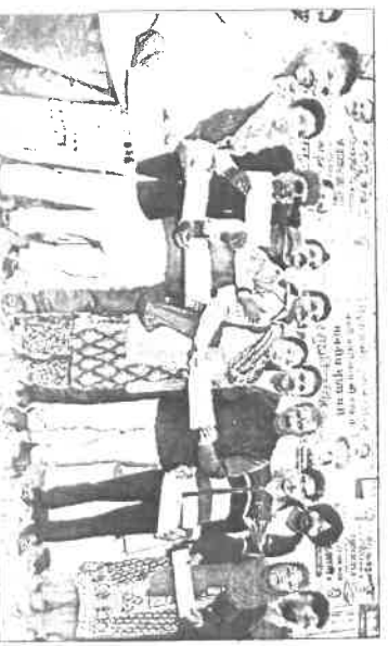
दिया हिमाचल यूरो - बददी

मुख्यमंत्री सुखविंदर सिंह सुखू ने केंद्र सरकार पर बड़ा सवाल उठाते हुए कहा कि प्रधानमंत्री ने आपदा के दौरान 1500 करोड़ रुपए का पैकेज घोषित किया था, पर आज तक एक रुपया भी नहीं आया। उन्होंने कहा कि वह भाजपा के सार्वजनिक सचिवों के साथ स्वयं दिल्ली जाने की तैयार हैं, बस प्रदेश हिल पर राजनीति न हो। मुख्यमंत्री सुखविंदर सुखू ने कहा कि प्रदेश सरकार आपदा प्रभावित परिवारों को हरसंभव मदद कर रही है। उन्होंने कहा कि विनाशकारी आपदा के दौरान उन्होंने स्वयं प्रभावित क्षेत्रों का दौरा किया और जमीनी हलाल देखकर विशेष राहत पैकेज जारी किया। उन्होंने कहा कि प्रभावित परिवारों को वित्तीय सहायता देकर मदद मिले, इसके लिए प्रदेश सरकार ने हिमाचल राहत नियमावली में बड़े बदलाव किए। आज पर दोबारा सरकार सिर्फ घोषणाओं तक सीमित नहीं है। उन्होंने कहा कि हम हर पीड़ित परिवार तक राहत पहुंचाने के लिए संकल्प का प्रमाण है। कार्यक्रम के दौरान मुख्यमंत्री ने दून विधानसभा क्षेत्र के पीड़ित परिवारों को सीधे राहत पहुंचाते हुए 18 आपदा प्रभावित परिवारों को 17,62,000 रुपए की सहायता राशि सौंपी। साथ ही प्रधानमंत्री आवास योजना ग्रामीण के 15 लाभार्थियों को 17,03,000 रुपए की अंतिम किस्त के चेक प्रदान किए। इसके अतिरिक्त क्षेत्र रोग उन्मूलन अभियान के तहत तीन टीबी मरीजों को विशेष किट भी प्रदान की गई। मुख्यमंत्री सुखविंदर सुखू ने कहा कि कांग्रेस सरकार सिर्फ घोषणाओं तक सीमित नहीं है। उन्होंने कहा कि हम हर पीड़ित परिवार तक राहत पहुंचाने के लिए संकल्प का प्रमाण है। कार्यक्रम के