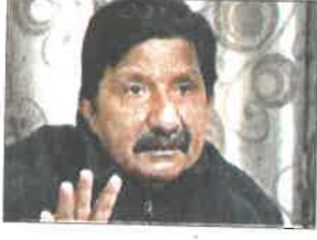
दिव्य हिमाचल ब्यूरो - ऊना

उपमुख्यमंत्री मुकेश अग्निहोत्री ने कहा कि हम हिमाचल प्रदेश के सर्वांगीण विकास के लिए वचनबद्ध हैं। उन्होंने कहा कि प्रदेश के हर खेत और घर को पानी मिले, इसके लिए काम किया जा रहा है। इससे पहले उप मुख्यमंत्री मुकेश अग्निहोत्री ने केंद्रीय जल शक्ति मंत्री सीआर पाटिल से शिष्टाचार भेंट कर हिमाचल प्रदेश के लिए प्रधानमंत्री कृषि सिंचाई योजना के