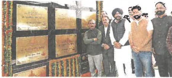
विभिन्न विकास कार्यों का शिलान्यास करते मुख्यमंत्री सुखविंदर सिंह।