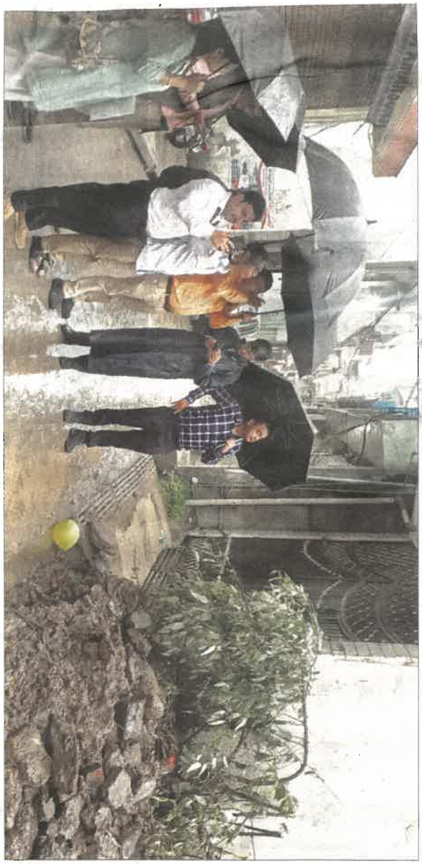
The inter-ministerial central team takes stock of damage in Inner Akhara Bazaar of Kullu town on Monday.