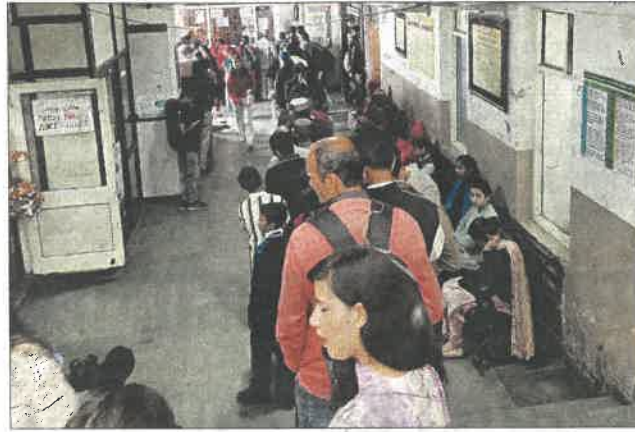
शिमला के डीडीयू अस्पताल में लगीं मरीजों की भीड़। संवाद

300 बेड वाला जोनल अस्पताल में जनरल मेडिसिन, सर्जरी, ऑर्थोपेडिक्स, गायनेकोलॉजी, पेडियाट्रिक्स, डर्मेटोलॉजी, आई क्लिनिक, ईएनटी, डेंटल, रेडियोलॉजी, ब्लड बैंक और