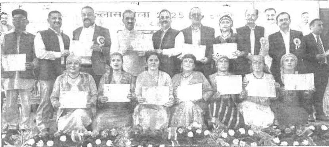
Chief Minister Sukhvinder Singh Sukhu during the "Puran Sakshar Himachal Samaroh and Ullas Mela-2025" in Shimla on Monday.