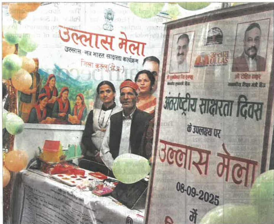
A volunteer teacher with her student (wearing cap) in Shimla on Monday.

19,000 torchbearers of knowledge turn 42,578 lives from non-literate to neo-literate