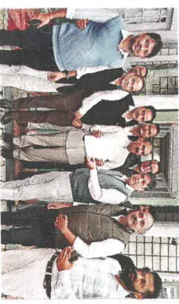
कर्मचारी हितों का संरक्षण प्राथमिकता: सीएम