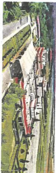
गगल स्थित कांगड़ा हवाई अड्डा, जिसका विस्तार प्रस्तावित है • जगल प्राधिकरण

प्राधिकरण ने यह स्पष्ट किया है कि हवाई पट्टी की लंबाई बढ़ाने के लिए समीपवर्ती नाले का तटीकरण कैसे किया जाएगा, इस पर विस्तृत योजना को आवश्यकता है ताकि