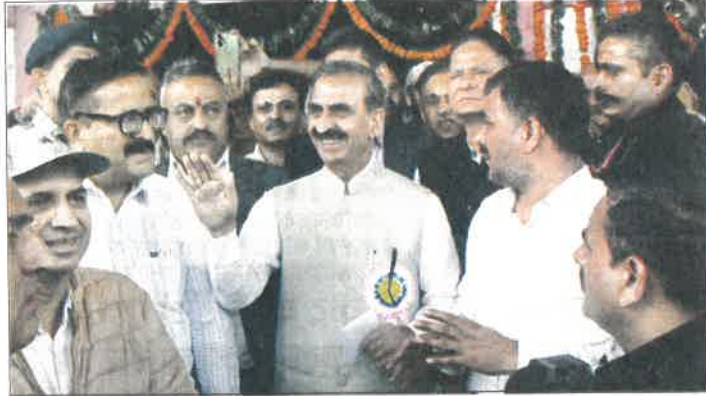
शिमला : पीटरहॉफ में मुख्यमंत्री सुखविंदर सिंह सुक्खू कर्मचारियों को संबोधित करते हुए।

इस बीच राजधानी शिमला में सोमवार को कर्मचारियों ने अपनी ताकत दिखाई। हाइएस्ट ग्रेड पे की कटौती को लेकर जारी अधिसूचना को वापस लेने की मांग को