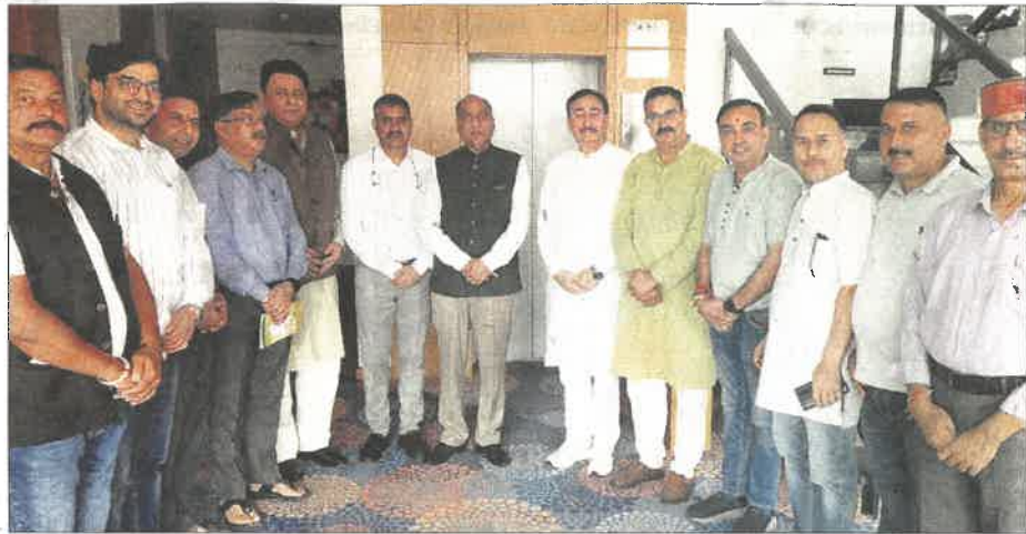
Leader of the Opposition Jai Ram Thakur, along with other BJP leaders, reviews arrangements for Prime Minister Narendra Modi's proposed visit to Dharamsala.

He highlighted widespread devastation caused by heavy rain during the ongoing monsoon season. "Repeated incidents of cloudburst, landslide and torrential rain have severely impacted lives, infrastructure and the state's economy," he added and cited the death of 42 persons in the rain disaster in Mandi district on June 30.