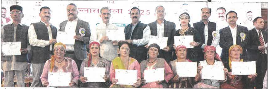
शिमला : अंतर्राष्ट्रीय साक्षरता दिवस पर पीटरहॉफ में आयोजित पूर्ण साक्षर हिमाचल प्रदेश एवं उल्लास मेला के दौरान मुख्यमंत्री सुखविंदर सिंह सुक्खू के साथ संयुक्त चित्र में सम्मानित किए गए अधिकारी, स्वयंसेवक व नवसाक्षर।

शिमला, 8 सितम्बर (कुलदीप): मुख्यमंत्री सुखविंदर सिंह सुक्खू ने कहा है कि सरकारी स्कूलों में सी.बी.एस.ई. व शिक्षा बोर्ड दोनों के पाठ्यक्रमों का समावेश किया जाएगा। इसके तहत 200 स्कूलों में सी.बी.एस.ई. पाठ्यक्रम को शुरू किया जाएगा। सुखविंदर सिंह सुक्खू होटल पीटरहॉफ में अंतर्राष्ट्रीय साक्षरता दिवस पर आयोजित पूर्ण साक्षर हिमाचल समारोह एवं उल्लास मेला-2025 के अवसर पर संबोधित कर रहे थे। इस अवसर पर हिमाचल प्रदेश को पूर्ण साक्षर राज्य भी घोषित किया गया। हिमाचल प्रदेश की साक्षरता दर अब 99.30 फीसदी पहुंच गई है, जो राष्ट्रीय मानक 95 फीसदी से कहीं अधिक है।