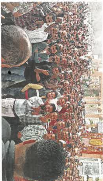
नोटिफिकेशन के विरोध में साचिवालय परिसर में गेट मीटिंग करते कर्मचारी।