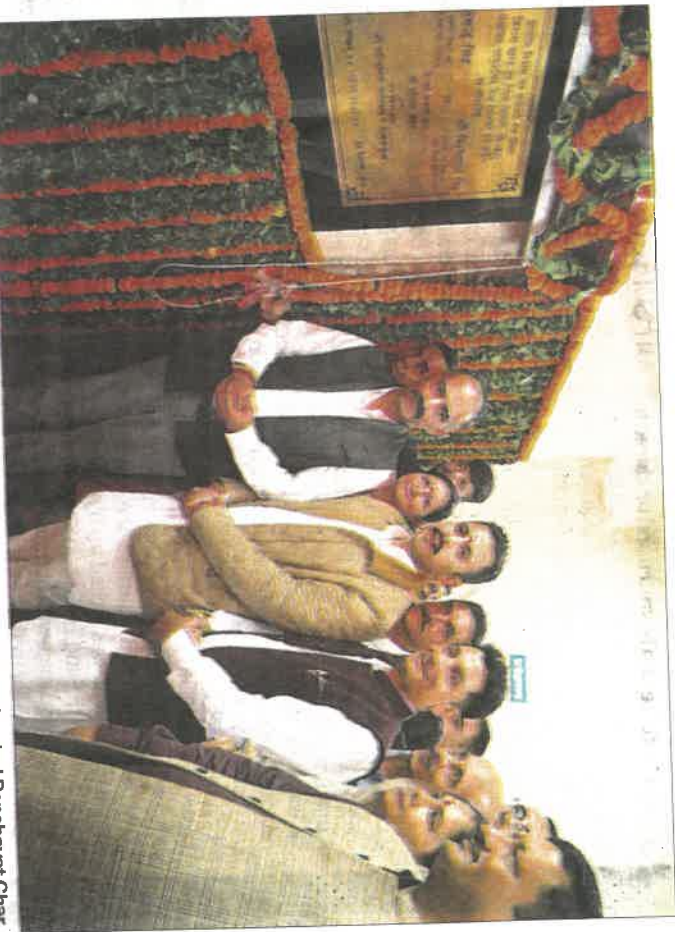
Ministers Vikramaditya Singh and Anirudh Singh inaugurate the newly constructed Panchayat Ghar.

under different heads. He added that the restoration of Government Degree College, Dharni, damaged by heavy rains, is being carried out at a cost of Rs 5 crore. Speaking on the occasion, Minister Anirudh Singh credited former CM Virbhadra Singh for making Shimla (Rural) a hub of educational institutions. "As per the vision of CM Sukhinder Singh Sukhu, nine new Panchayat Ghars are being built in Shimla (Rural) at a cost of Rs 14.72 crore, of which seven will be inaugurated before the upcoming Panchayat elections," Anirudh Singh said. —TNS