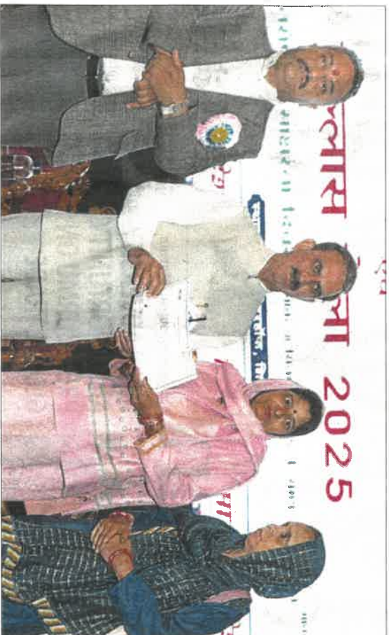
CM Sukhvinder Singh Sukhu honours a volunteer on the occasion of International Literacy Day during the 'Puran Sakshar Himachal Samaroh and Ullas Mela' in Shimla on Monday.

Sukhu, in his address, said, "At the time of independence, the entire country was known