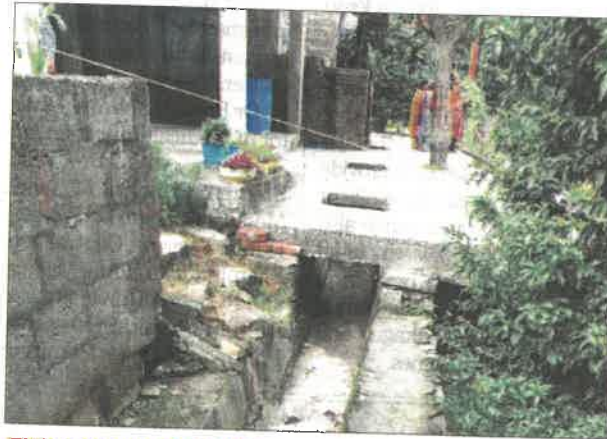
ENCROACHING DANGER An unauthorised structure jutting out beyond the drainage line in Kullu's Math area on Monday; and (below) a crumbling sewerage chamber in the Math locality.

Unchecked construction & crumbling civic systems in Kullu's Math area are turning slopes into ticking time bombs