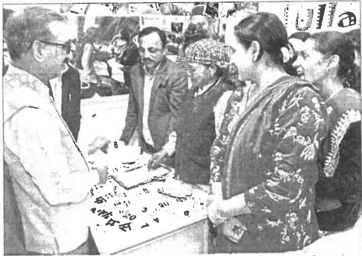
शिमला - 'पूर्ण साक्षर हिमाचल समारोह और उल्लास मेला-2025' के अवसर पर आयोजित प्रदर्शनी का मुआयना करते सीएम सुखविंदर सिंह सुखू

सीएम ने कहा कि 2023 की आपदा को जो पोस्ट डिजास्टर नीड असेसमेंट है, वह 10000 करोड़ का था। यह आकलन हमने नहीं, केंद्रीय टीम ने ही किया था। दो साल बाद मिला 2006 करोड़। उसमें भी जब 25 फीसदी हिस्सा हम देंगे। उसकी अभी पहली इंस्टालमेंट आई है 451 करोड़ की, उसके लिए भी मिछले बिल मांगे जा रहे हैं। इस बार जो नुकसान हुआ है, उसमें सेब अभी बागीचों में फंसा है। शिक्षा मंत्री अपने चुनाव क्षेत्र में सड़कों को खोलने में लगे हैं। मैं खुद मनाली गया था। वहां सेब फंसा पड़ा है। इस सारे काम में पैसा और समय लगेगा। उम्मीद है केंद्र सरकार इस बात को समझेगी।