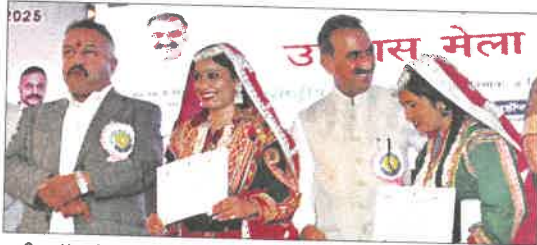
पीटरहॉफ शिमला में सोमवार को हिमाचल को साक्षर बनाने में अहम योगदान देने वालों को सम्मानित करते मुख्यमंत्री सुक्खू।