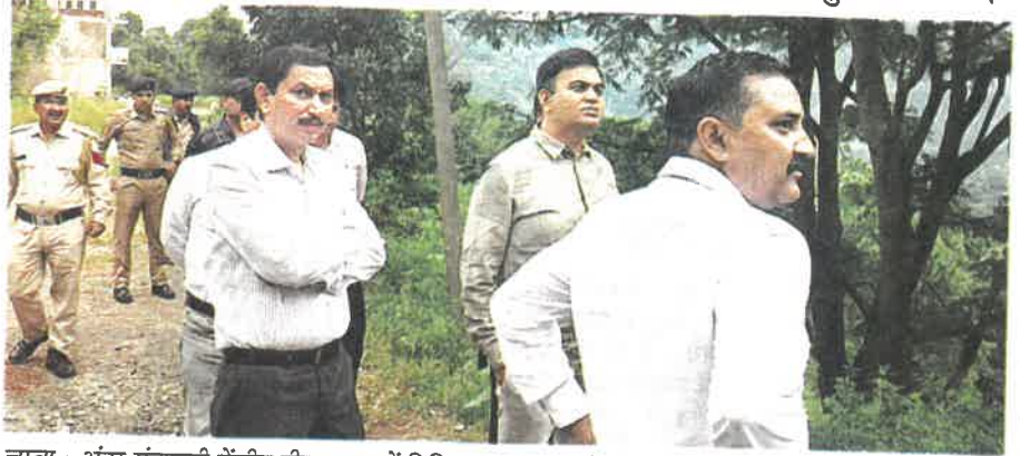
चम्बा : अंतर मंत्रालयी केंद्रीय टीम चम्बा में विभिन्न आपदा प्रभावित इलाकों का जायजा लेती हुई।