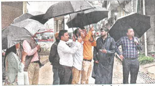
कुल्लू में आपदा प्रभावित क्षेत्र के दौरे पर पहुंचे केंद्रीय टीम के सदस्य।

केंद्र से आई टीम ने मनाली से लेकर कुल्लू तक आपदा से हुए भारी नुकसान का लिया जायजा