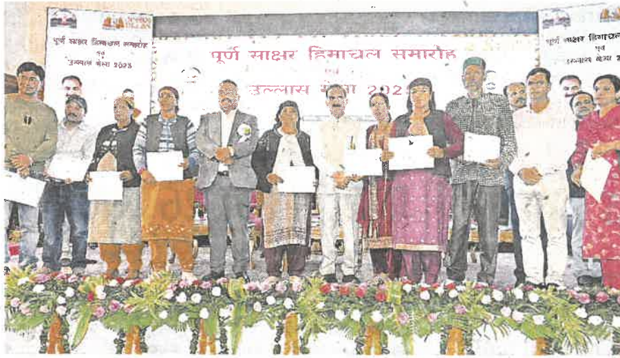
शिमला में सोमवार को मुख्यमंत्री सुखविंदर सिंह सुक्खू, शिक्षा मंत्री रोहित ठाकुर व अधिकारी लोगों को साक्षरता प्रमाणपत्र देते

साक्षरता के स्वयंसेवक के रूप में कार्य कर चुके शिक्षा सचिव