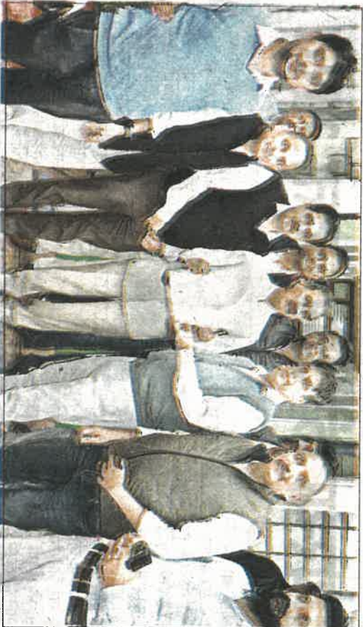
शिमला। हायर ग्रेड-पे संबंधी आदेश रद्द करवाने पहुंचे प्रदेश सावितालय सेवाएं कर्मचारी संगठन के पदाधिकारी