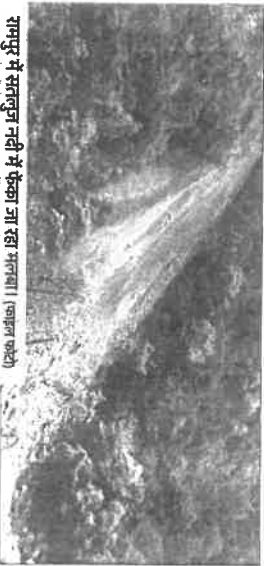
गामपुर में सतलुज नदी में फेंका जा रहा मलबा।

प्रदेश हाईकोर्ट की ओर से नियुक्त किए गए एमिकस क्यूरी की अध्यक्षता रिपोर्ट में ऐसे कई बुरासे हुए हैं। पहाड़ों को खोदकर नदी-नालों, खड्डों के किनारे डंप किया मलबा तबाही का सामान बन गया है। राष्ट्रीय राजमार्गों का निर्माण हो, बिजली परियोजनाएँ हों या फिर अन्य विकास कार्य, कंपनियाँ टनों के हिसाब से मलबा नदी-नालों के किनारे डंप कर मलबा नदी-नालों के किनारे डंप कर रहा है। भारी बरिशा में यह मलबा तबाही का कारण साबित हो रहा है। इससे भी बाढ़ की स्थिति पैदा हो रही