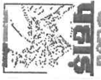
अन्य जगहों पर कचरा

09 SEP 2023 हिमालय-हिमाचल प्रदेश में मलबे को ठिकाने लगाने के लिए पंचायतों और शहरी निकायों के पास एक भी डंपिंग साइट नहीं है। बड़ी परियोजनाएं बना रही कंपनियों को कामजोरों में डंपिंग साइटें हैं, परंतु यहाँ भी नियमानुसार मलबे को ठिकाने नहीं लगाया जा रहा है। हिमाचल प्रदेश नियंत्रण बोर्ड के पास ऐसे कई मामले पहुँच चुके हैं।