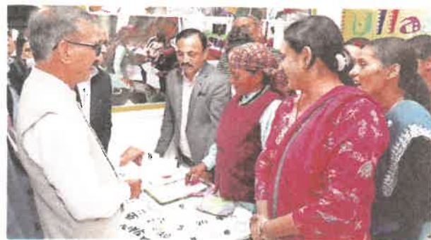
CM Sukhvinder Singh Sukhu on the occasion of International Literacy Day, in Shimla on Monday.

The section 7A provided that the posts/categories, whose Pay Band or Grade Pay was not re-revised after implementation of Revised (Pay) Rules, 2009, the pay in applicable Level in Pay Matrix as on January 1, 2016, shall be obtained by multiplying the existing basic pay as on December 31, 2015, by factor 2.59 while the multiplying factor would be 2.25 after omitting section 7A of the Rules.