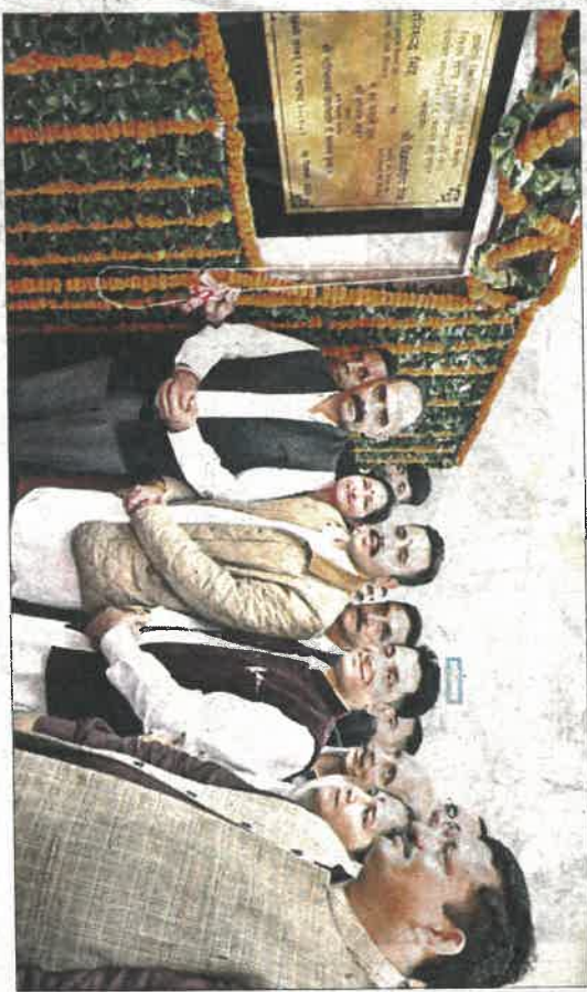
शिमला : सोमवार को घंडल पंचायत घर का लोकार्पण करते पंचायती राज एवं ग्रामीण विकास मंत्री अनिरुद्ध सिंह और लोक निर्माण एवं शहरी विकास मंत्री विक्रमादित्य सिंह

अत्याधुनिक सुविधाओं से लैस पंचायत घर है। प्रदेश के मुख्यमंत्री सुखविरंदर सिंह सुम्बू के दिशा-निर्देशों के अनुसार ही एक समान पंचायत घर निर्मित किए जा रहे हैं। शिमला ग्रामीण में इस तरह के नौ नए पंचायत घर बनाए जा रहे हैं। इन पर 14.72 करोड़ रूपए खर्च किए जा रहे हैं। इनमें से सात का लोकार्पण पंचायत चुनावों से पहले ही कर दिया जाएगा। उन्हींने ओगली पंचायत के लिए 10 लाख रूपए और धरियाना पंचायत के लिए 10 लाख रूपए देने की घोषणा की। उन्होंने कहा कि चमियाना सुपर स्वेशियलिटी के लिए भविष्य में 2000 करोड़ रूपए खर्च किए जाएंगे। इससे लोगों को अत्याधुनिक सुविधाएं प्राप्त होंगी। सरकारी आत्मनिर्भर हिमानवल प्रदेश की दिशा में प्रभावी तरीके से आगे बढ़ रही है। केंद्र सरकार की ओर से बजट में कटौती के बाद