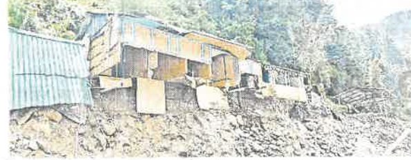
ओल्ड मनाली के मनालसु नाले के ऊपर पहाड़ी पर लटके मकान व दुकानें